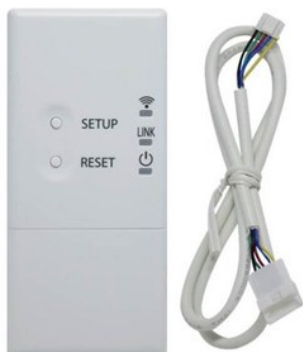
RB-N104S-G Toshiba Wifi modul